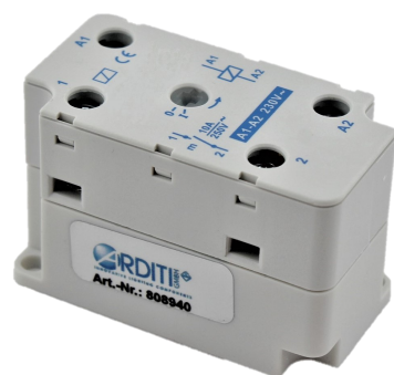
808940 Schaltrelais 10 A / 230 Vac Switching relay 10 A / 230 Vac

Mit Klebepads, Größe 75 x 45 mm With adhesive pads, size 75 x 45 mm