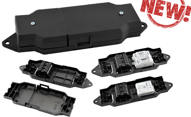
800659 Installationsbox für CASAMBI-Aktoren Installation box for CASAMBI actuators

Mit Anschlussklemmenblock With terminal block