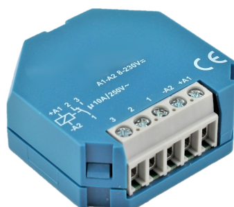
808942 Elektronisches Schaltrelais 10 A / 230 Vac Electronic switching relay 10 A / 230 Vac

Größe 50 x 27 x 32 mm Size 50 x 27 x 32 mm