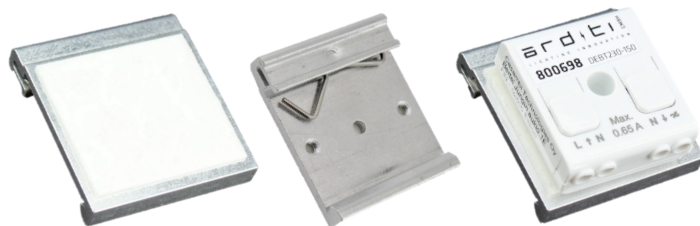
808977 DIN-Tragschienen-Adapter klein DIN rail adapter small

Größe 207 x 66 x 30 mm Size 207 x 66 x 30 mm